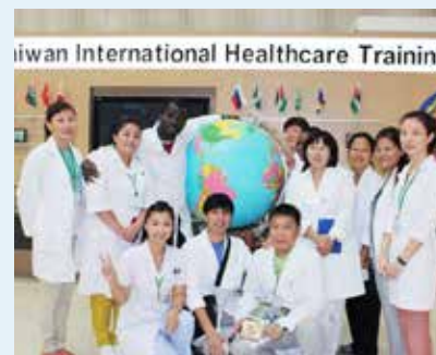
TIHTC 培訓上千位醫衛人才，為國際醫衛界注入新活力。