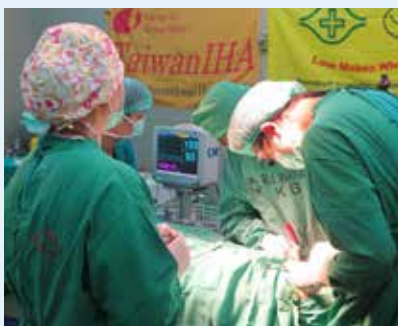
TaiwanIHA持續為印尼、越南等地貧困唇顎裂患者進行免費手術治療。

從國際醫衛援助計畫至醫衛人才的培訓與醫療器材的捐助與維護，臺灣團隊在國際醫衛領域的貢獻，世界各國有目共睹，而這樣的努力也會一直持續下去，除彰顯臺灣積極回饋國際社會之熱忱，更鼓舞國內外夥伴加入國際醫衛援助的行列，攜手合作，共同為全球人民之健康與福祉盡一份心力！